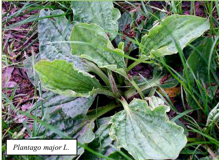
Plantago major L.