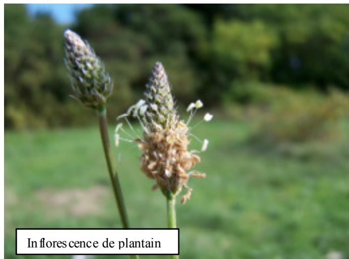
In florescence de plantain