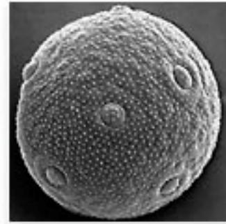
Pollen de plantain (microscopie électronique)

Les plantains sont des plantes herbacées généralement vivaces (de rares espèces sont annuelles) appartenant au genre Plantago . Ce genre comprend plusieurs espèces très communes partout en Europe qui abondent dans les champs, les prés, les bords de route,... Facilement reconnaissable, grâce à son épi caractéristique, les plantains pollinisent d'avril à octobre avec un maximum des émissions polliniques en mai et juin.